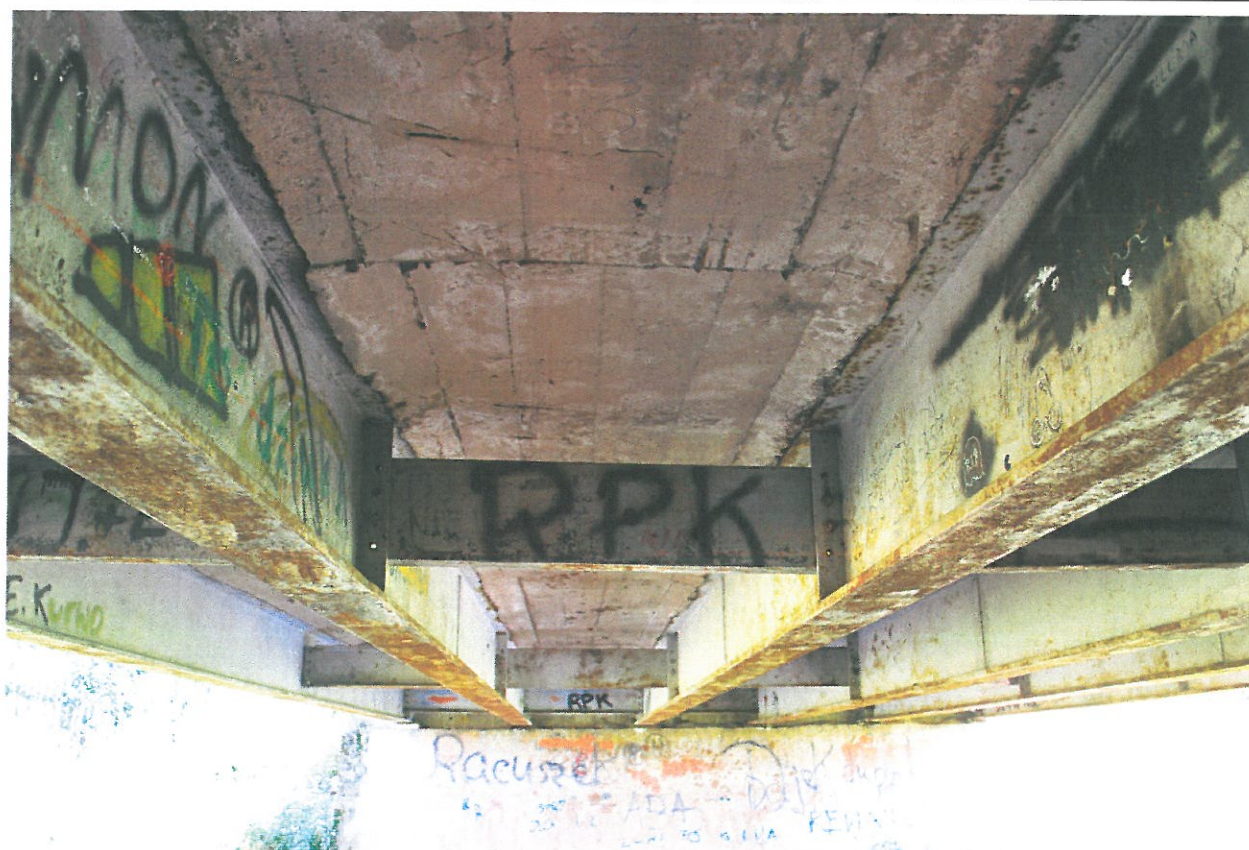
Fot. 4. Widok od spodu