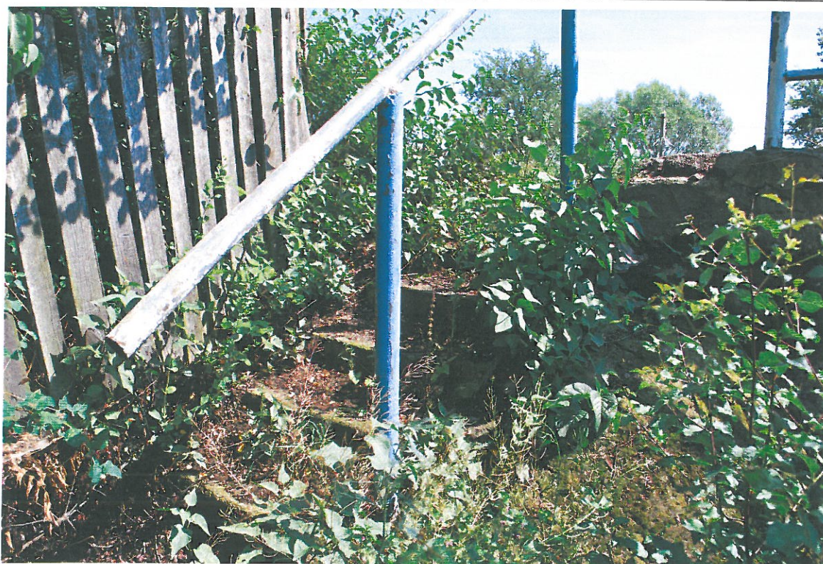
Fot. 6. Wegetacja roślin, zanieczyszczenia i ubytki schodów skarpowych (stożek od strony północnej – widok od strony dolnej wody)