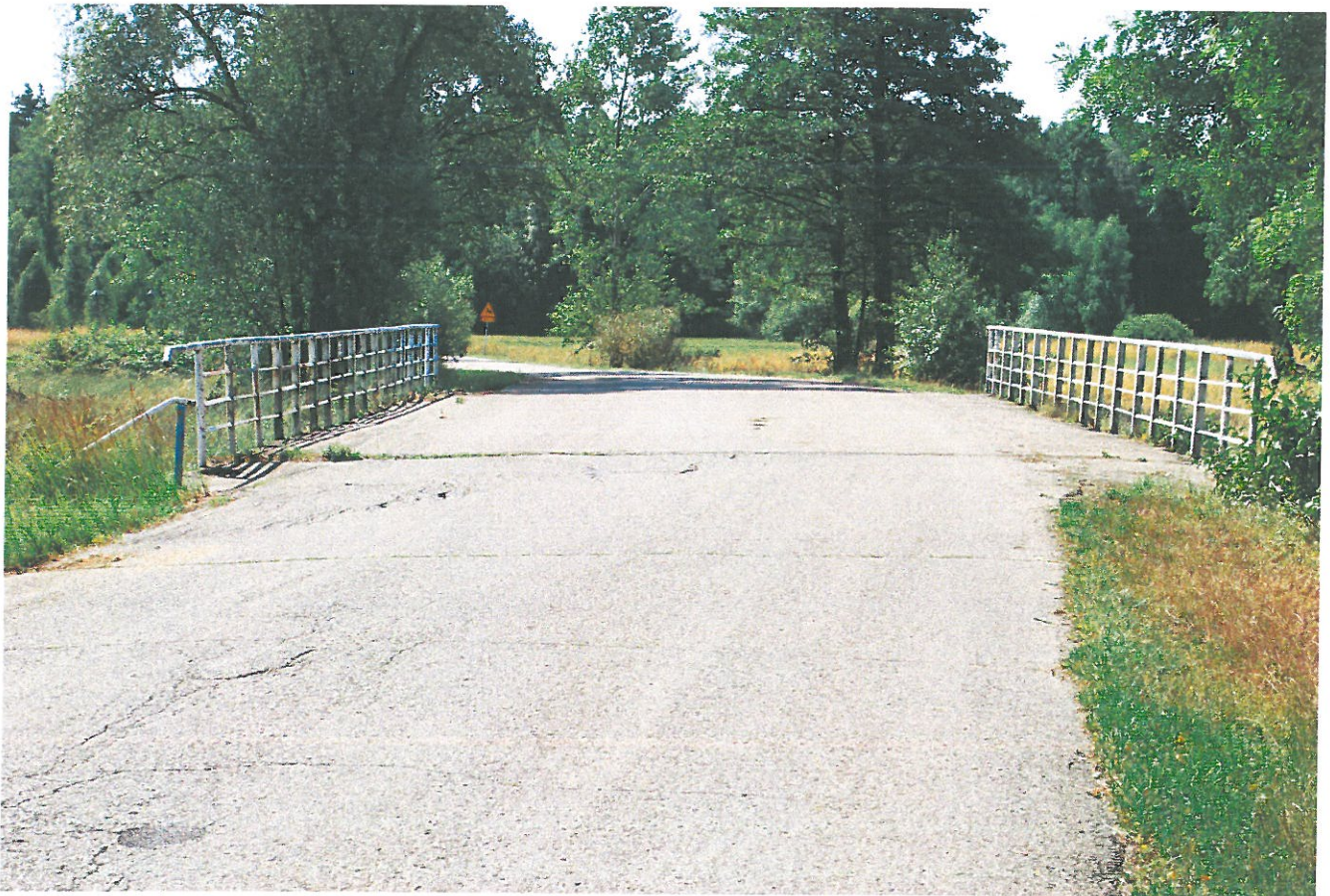
Widok ogólny mostu