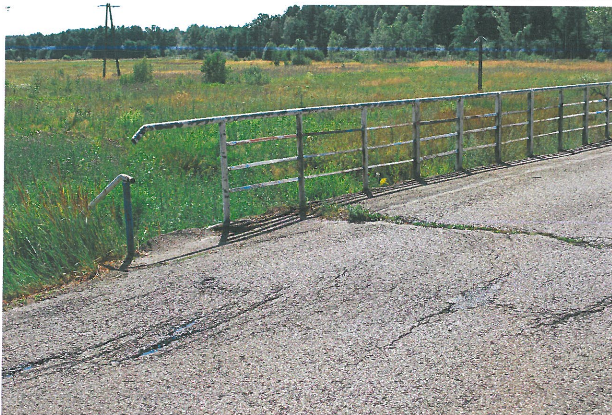
Fot. 7. Rysy, ubytki, deformacje nawierzchni jezdni na dojeździe od strony północnej.