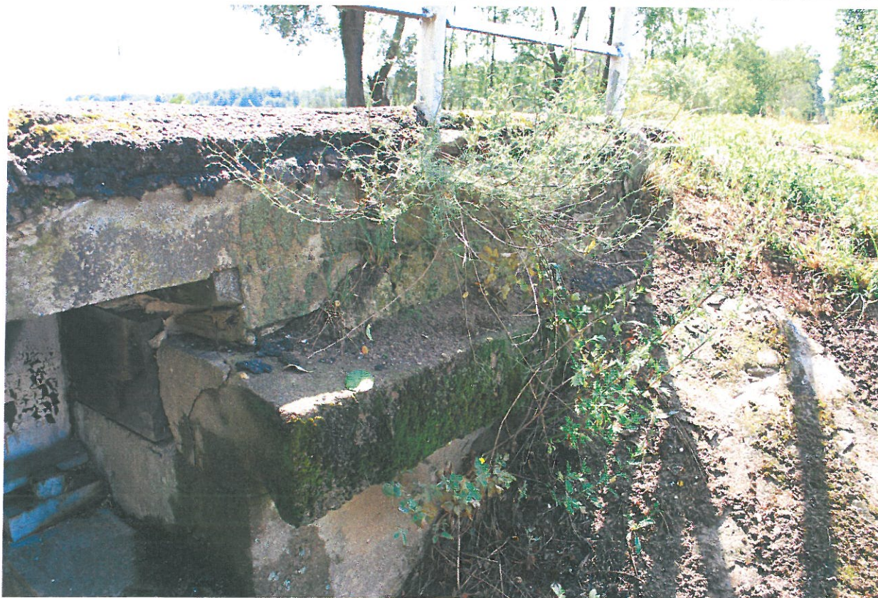
Fot. 24. Wegetacja roślin, zanieczyszczenia oraz rysy skrzydełka przyczółka – widok od strony południowej.