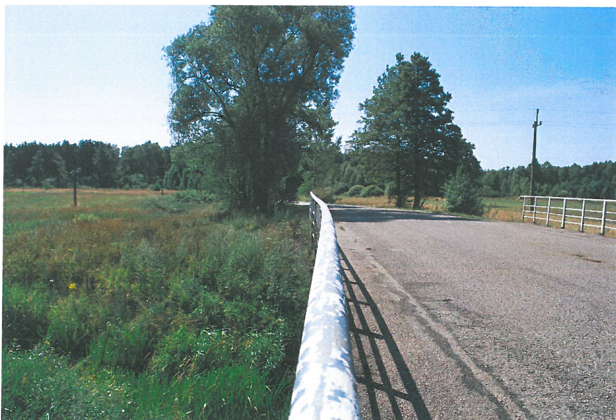
Fot. 12. Deformacja balustrady - widok od strony górnej wody.