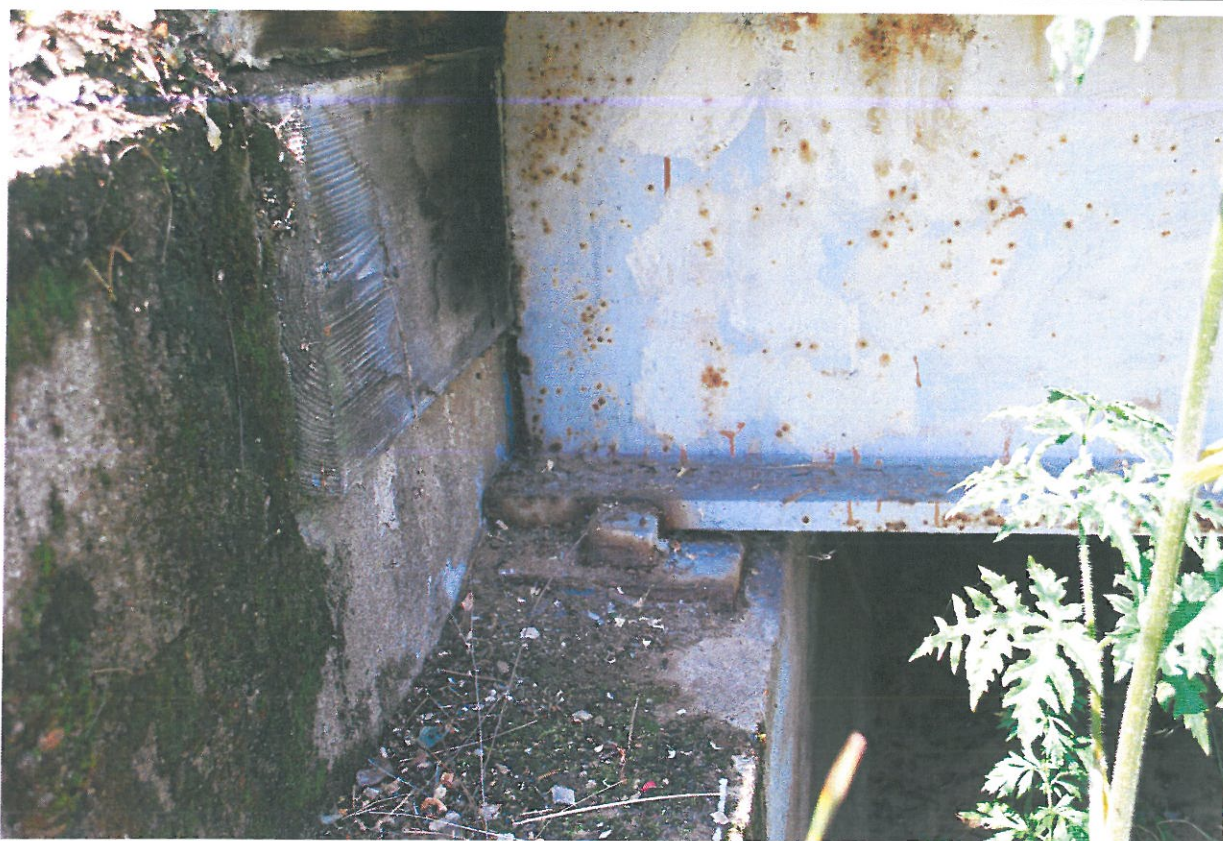
Fot. 19. Zniszczenie zabezpieczeń antykorozyjnych, korozja i zanieczyszczenia łożyska stalowego.