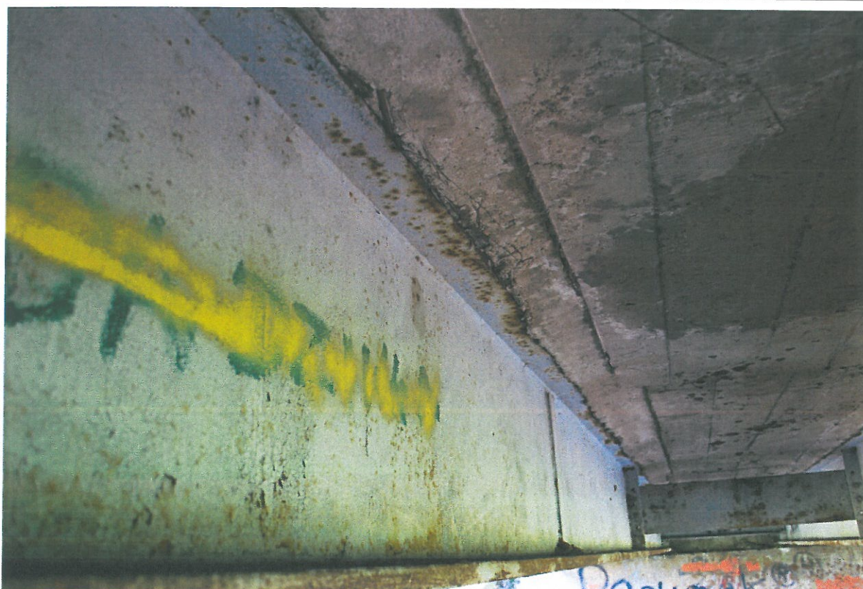
Fot. 16. Ubytki betonu, korozja betonu, korozja odsłoniętych prętów zbrojeniowych oraz zacieki i wykwitwy świadczące o braku skuteczności izolacji płyty pomostu.