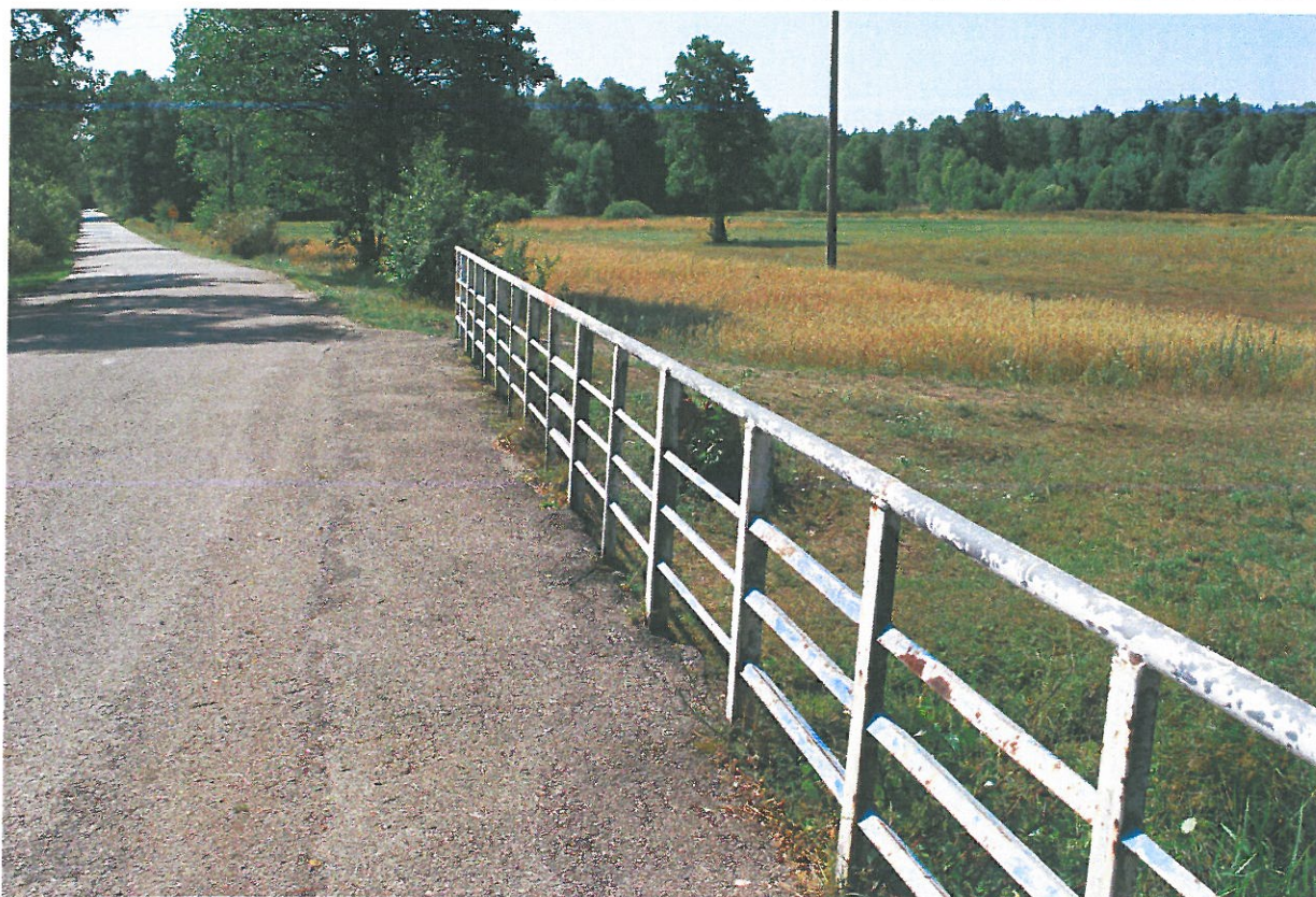
Fot. 11. Zniszczenie zabezpieczeń antykorozyjnych oraz zaawansowana korozja przeciągów i słupków balustrady – widok od strony dolnej wody.