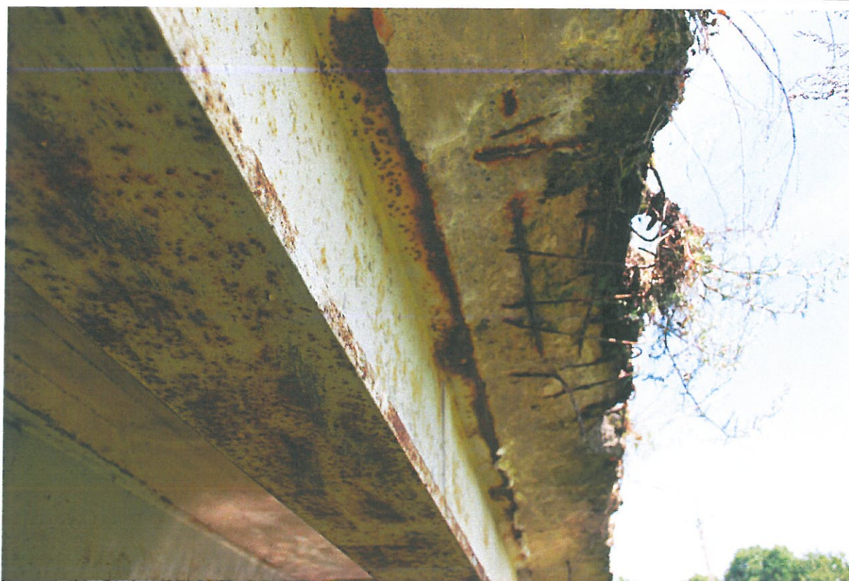
Fot. 15. Ubytki betonu, korozja betonu, korozja odsłoniętych prętów zbrojeniowych wspornika płyty pomostu.