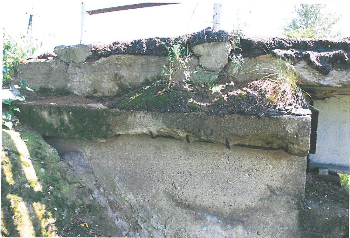
Fot. 22. Wegetacja roślin, zanieczyszczenia, ubytki betonu i korozja stali zbrojeniowej skrzydełka przyczółka – widok od strony północnej.