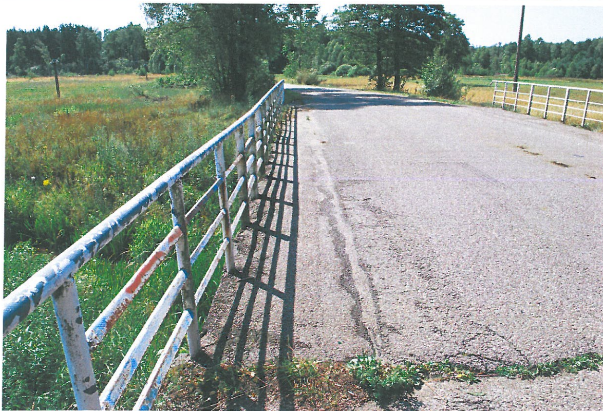
Fot. 1. Widok od strony północnej