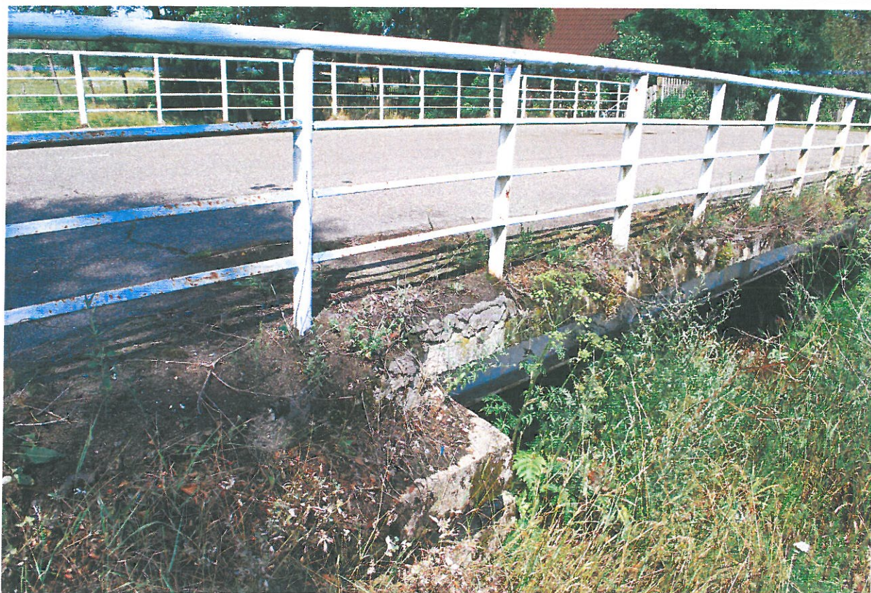
Fot. 13. Wegetacja roślin, zanieczyszczenia i ubytki betonu gzymsu – widok od strony górnej wody.