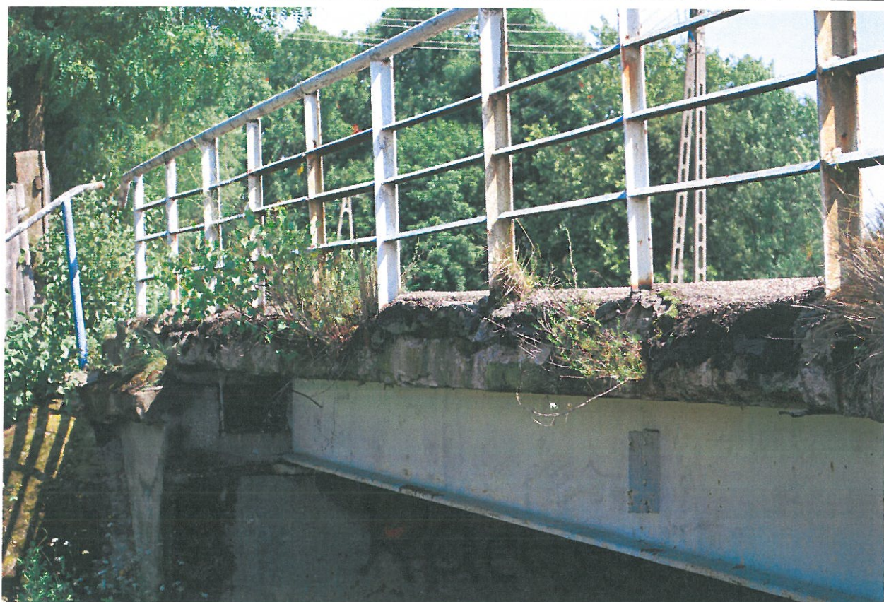
Fot. 14. Wegetacja roślin, zanieczyszczenia i ubytki betonu gzymsu – widok od strony dolnej wody.