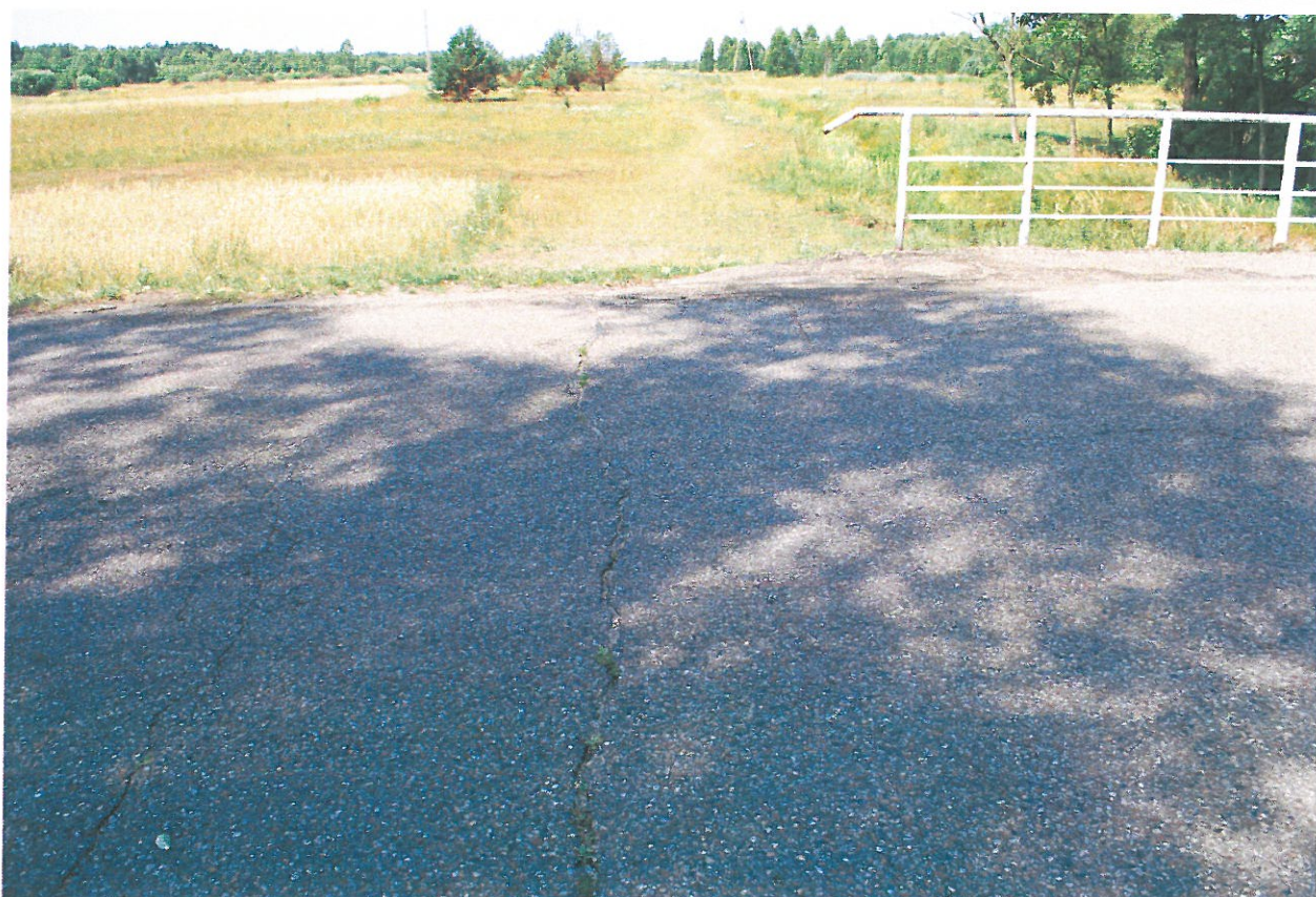
Fot. 8. Rysy, ubytki, deformacje nawierzchni jezdni na dojeździe od strony południowej.