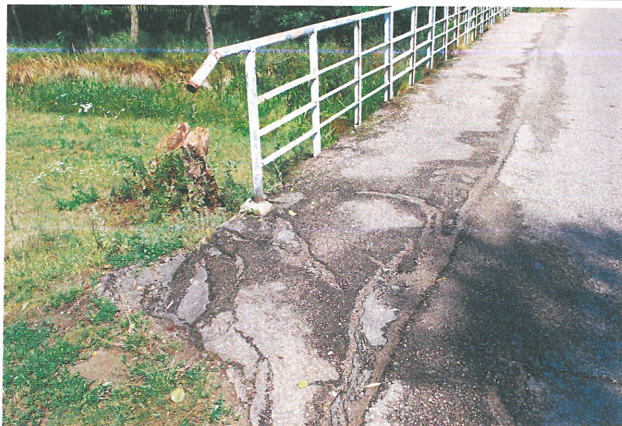
Fot. 9. Zanieczyszczenia, rysy, ubytki, deformacje nawierzchni jezdni – widok od strony dolnej wody