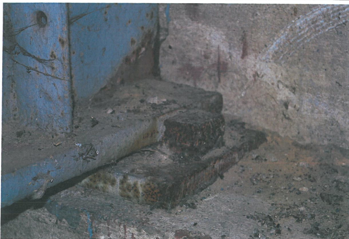
Fot. 20. Zniszczenie zabezpieczeń antykorozyjnych, korozja i zanieczyszczenia łożyska stalowego.