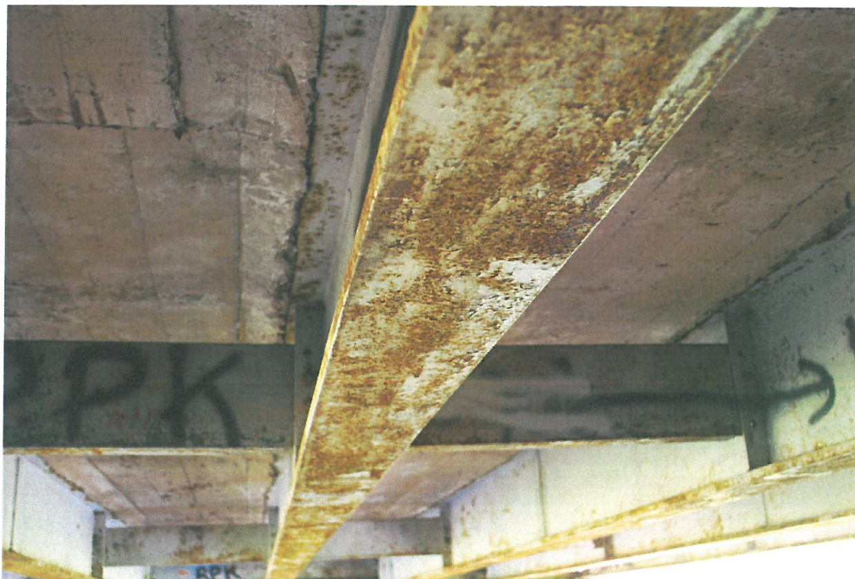
Fot. 18. Zniszczenie zabezpieczeń antykorozyjnych, korozja i zanieczyszczenia konstrukcji stalowej mostu.