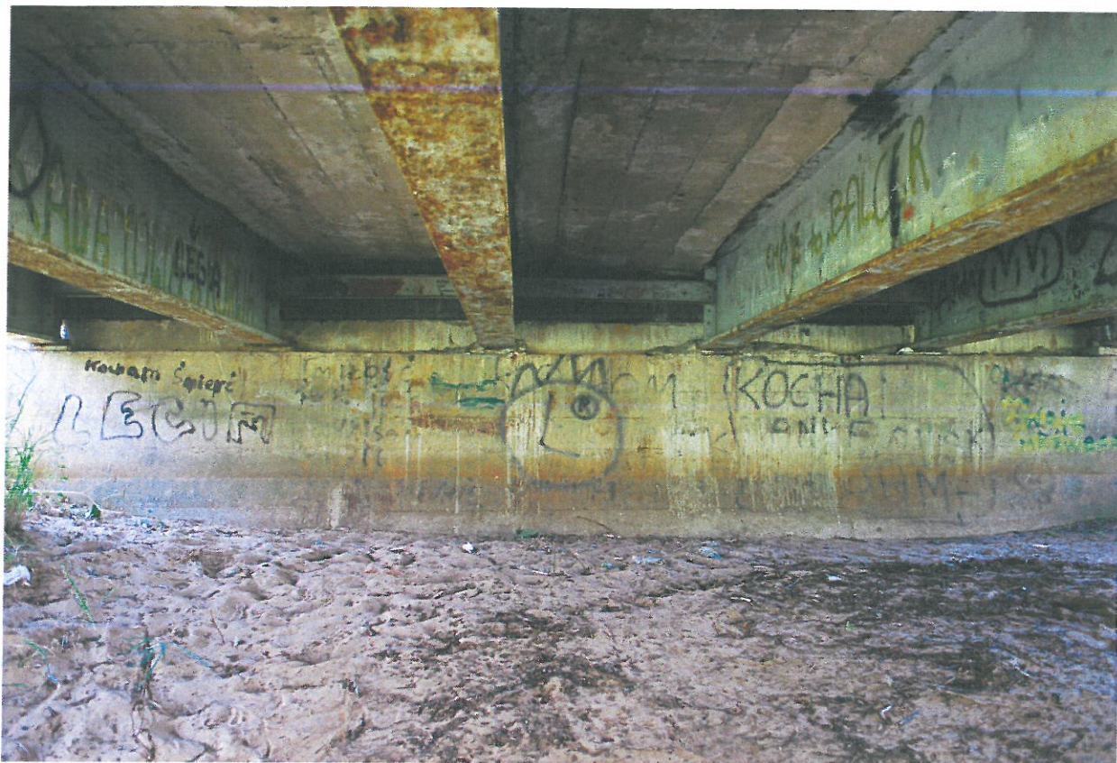
Fot. 23. Zanieczyszczenia przyczółka – widok od strony południowej.