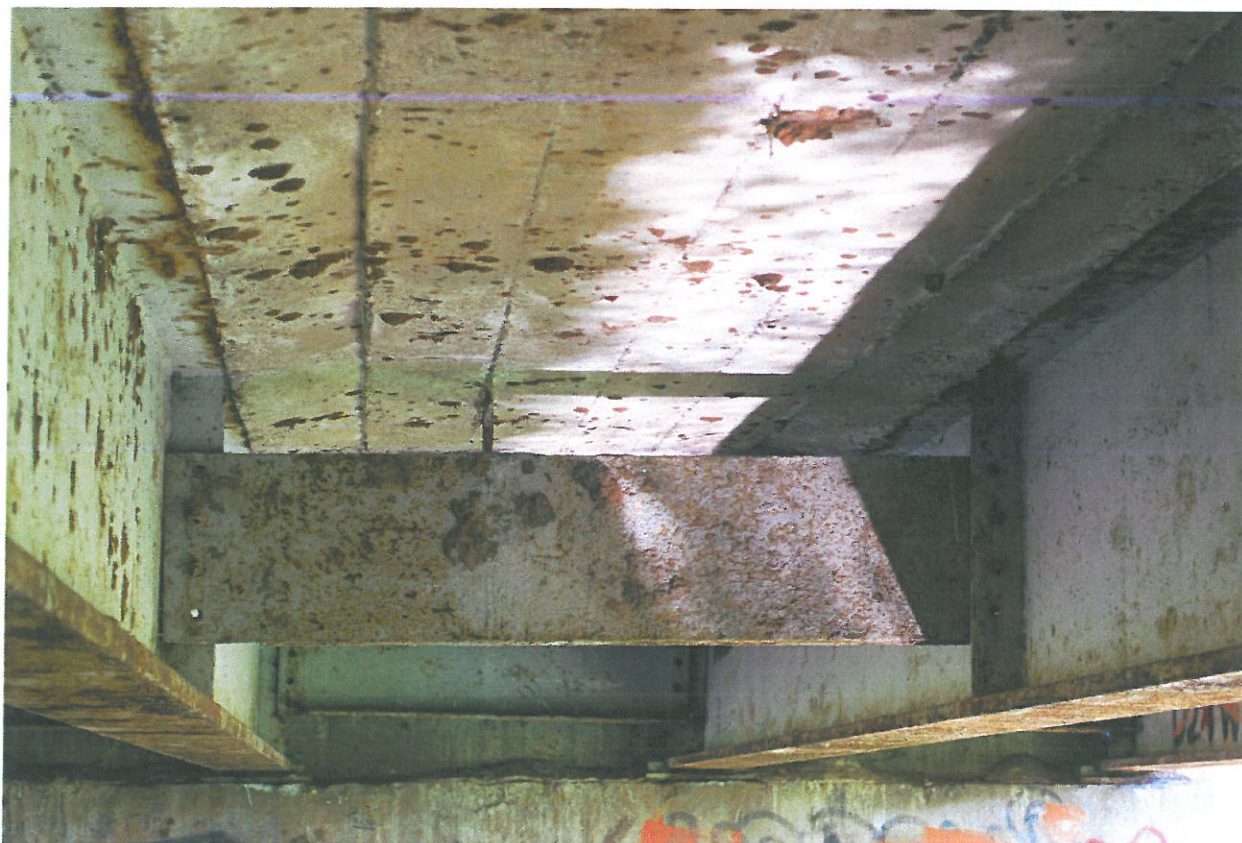
Fot. 17. Zniszczenie zabezpieczeń antykorozyjnych, korozja i zanieczyszczenia konstrukcji stalowej mostu.