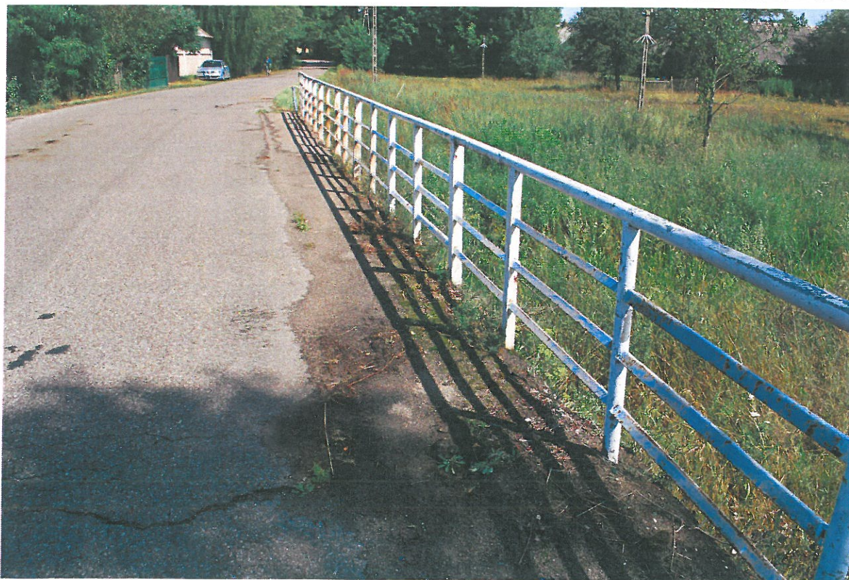
Fot. 10. Zanieczyszczenia, rysy, ubytki, deformacje nawierzchni jezdni – widok od strony górnej wody