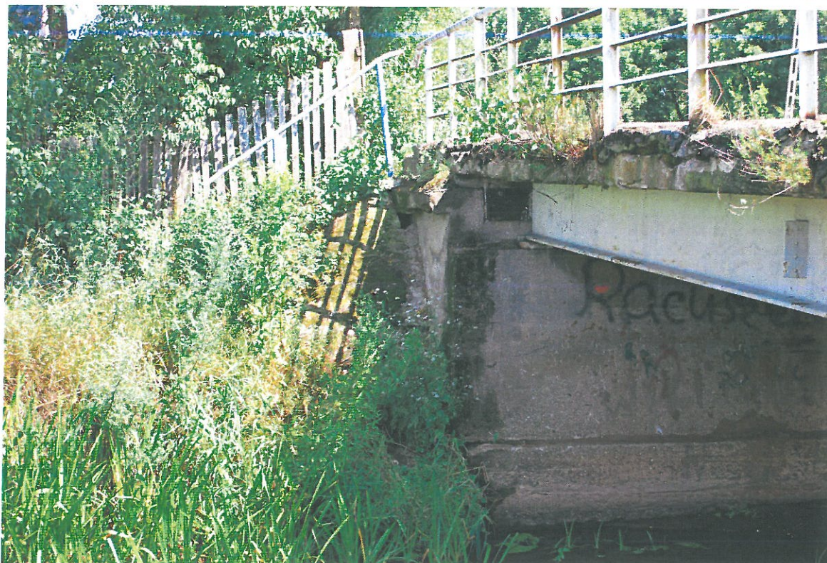
Fot. 5. Wegetacja roślin, zanieczyszczenia oraz ubytki wzmocnienia stożka spowodowane brakiem systematycznych prac utrzymaniowych - stożek od strony północnej i dolnej wody.