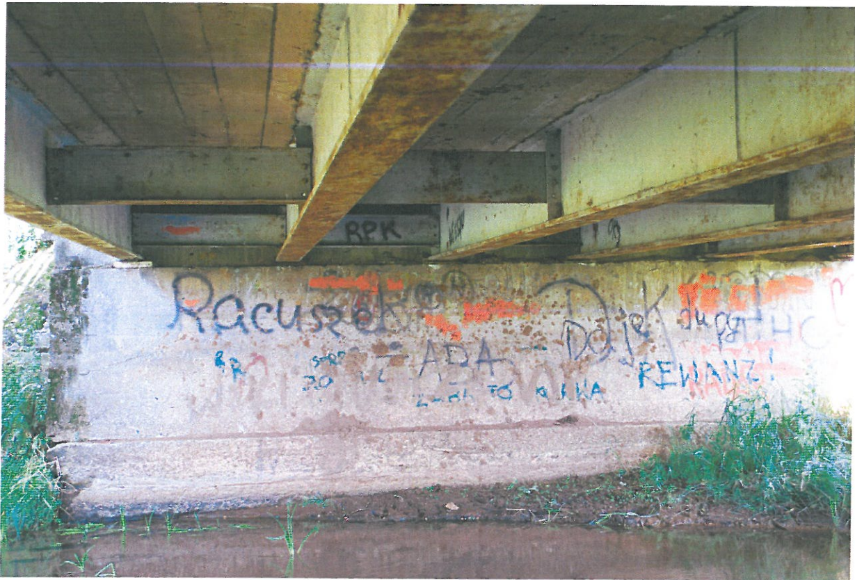
Fot. 21. Wegetacja roślin, zanieczyszczenia i ubytki betonu przyczółka – widok od strony północnej.