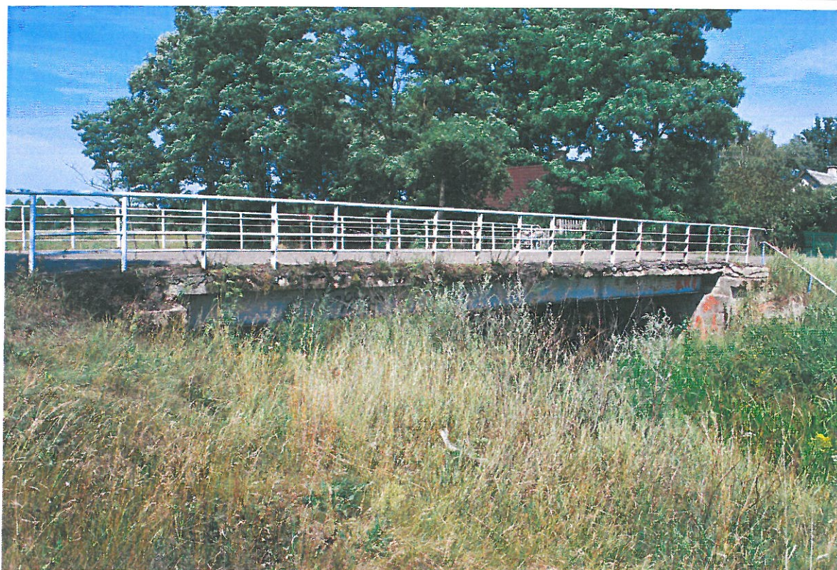
Fot. 2. Widok z boku od strony górnej wody