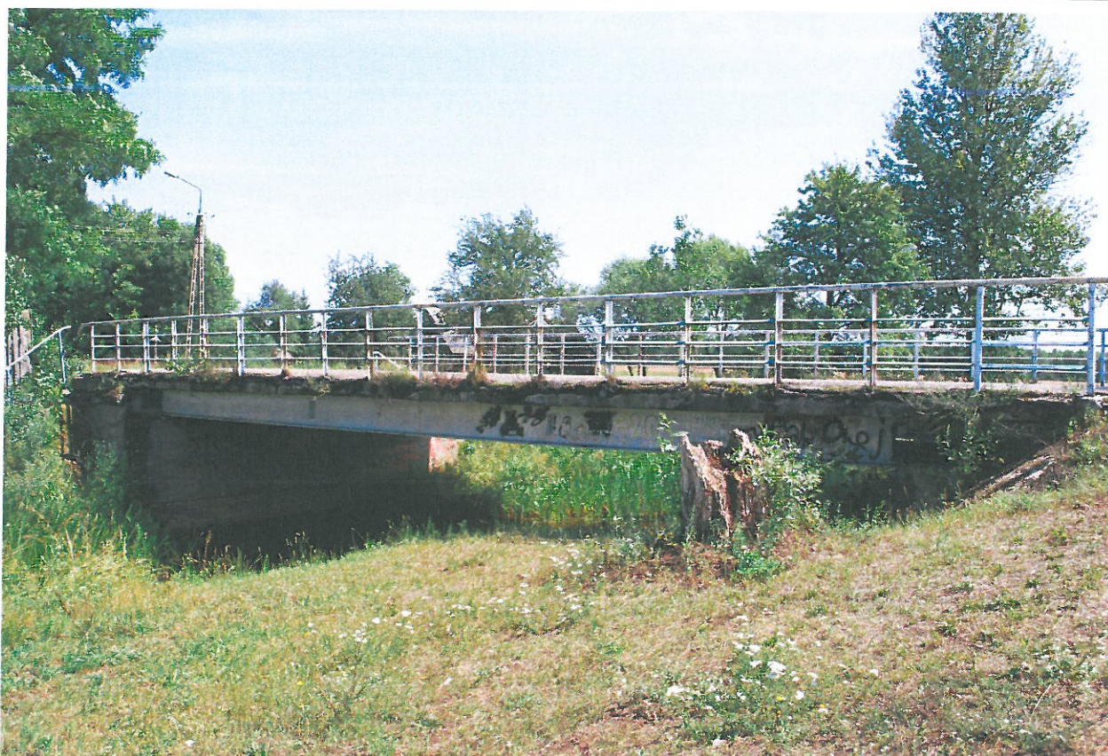
Fot. 3. Widok z boku od strony dolnej wody